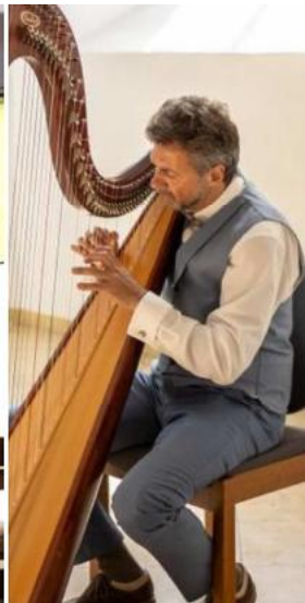
Text und Bilder: Michael Scholl