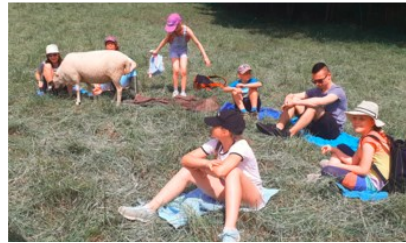
Die Schleichacher Ministranten

In Unterschleichach auf dem Erlebnis- bauernhof