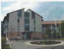
St. Martin mit St. Anna, Hofheim

Haus St. Bruno – Caritas und Kirche unter einem Dach, Promenade 37, 97437 Haßfurt Tel. 09521 926-0