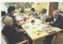
Tagespflege St. Martin, Hofheim

Tagespflege (St. Martin Hofheim) Tel. 09523 925-0 mit Hol- und Bringdienst