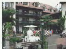
St. Bruno, Haßfurt