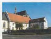
Caritashaus Julius Echter