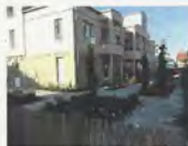
St. Martha, Knetzgau

Ambulant betreute Wohngemeinschaft St. Martha, Haigstr. 1, 97478 Knetzgau Pflege und Betreuung erfolgen durch die Caritas-Sozialstation Mail sst@caritas-hassberge.de